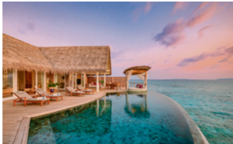
Ein Paradies für sich ist die Ocean Residence Milaidhoo.

Reisen mit Familie und Freunden sind gefragt denn je. Gut, wer entsprechend gerüstet ist. Auch im indischen Ozean passen die Hotels ihr Angebot der erhöhten Nachfrage nach Mehrbettsuiten und -villen an.