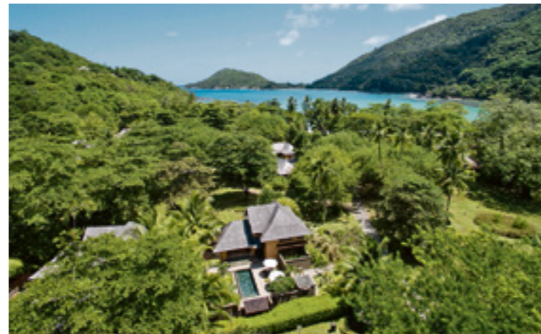
Die Villen des Constance Ephelia Seychelles lassen keine Wünsche offen.

Die Wasservilla auf der Malediveninsel Milaidhoo, die zweistöckige Villa mit Pool und Garten im Westen von Mauritius und das kreolische Chalet am Strand von Cote d'Or im Nordosten der Seychellen-Insel Praslins haben alle etwas gemeinsam: Sie bieten mehrere Schlafzimmer und kommen damit dem Bedürfnis nach Reisen in Gesellschaft nach.